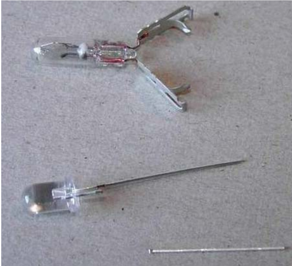
Oben das original Lämpchen, mit Kontakten, ohne Plastikhalterung darunter ein LED, und ein abgeknipster Beinchen.